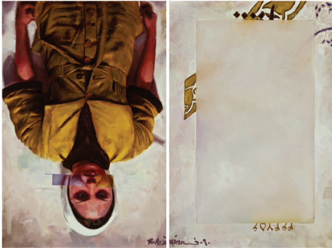
از توصیه به دیگران خودداری نمایندگی ۱ از مجموعه دانلودها، رنگ روغن روی بوم، ۱۸۰×۲۴۰ سانتی متر، (هر لته ۱۸۰×۱۲۰ سانتی متر)، ۱۳۹۰ Do Not Prescribe to Others No.1 from the Download series, oil on canvas, diptych, 180 x 240 cm overall, 180 x 120 cm each panel, 2011