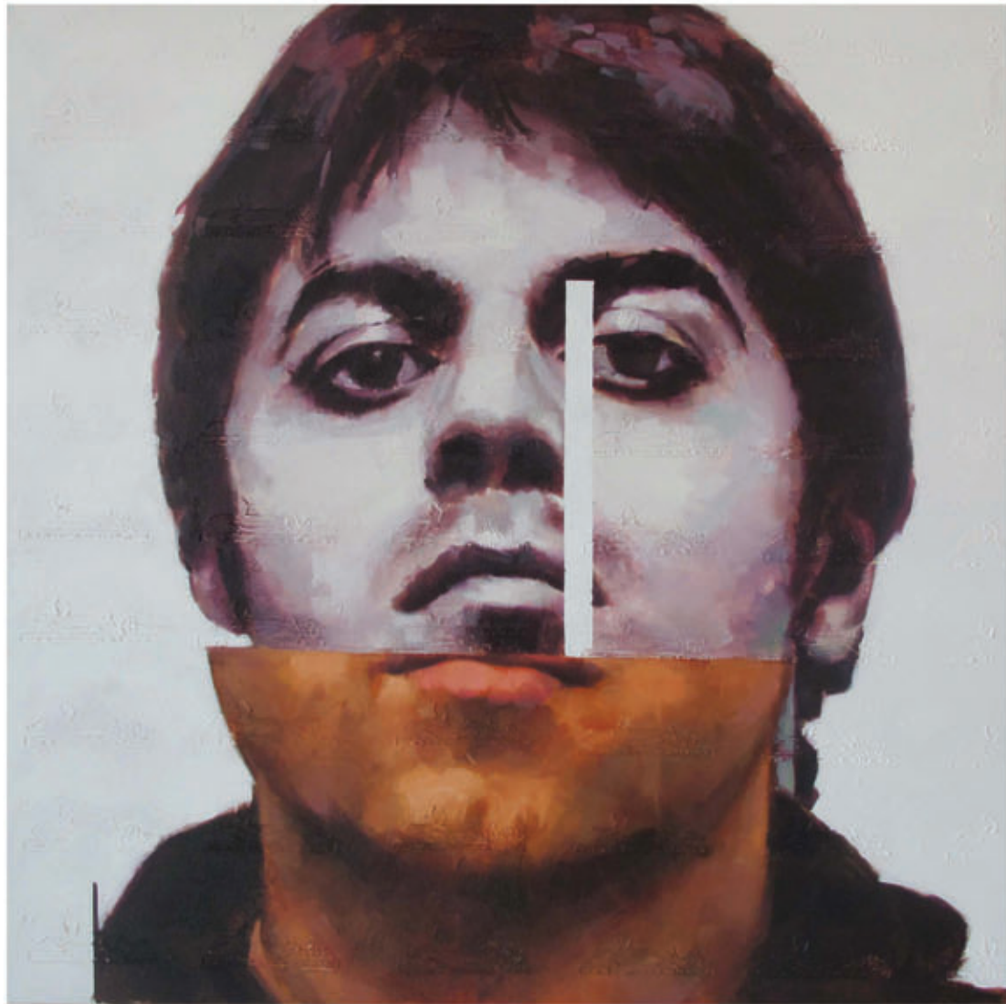
بنزودیازپین ها از مجموعه دانلودها، رنگ روغن روی بوم، ۱۵۰x۱۵۰ سانتی متر، ۱۳۹۰ Benzodiazepines from the Download series, oil & mixed media on Canvas, 150 x 150 cm, 2011